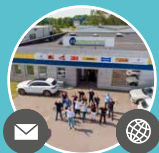
FÄRGPRODUKTER PLYM & CO AB Sporregatan 11, 213 77 Malmö